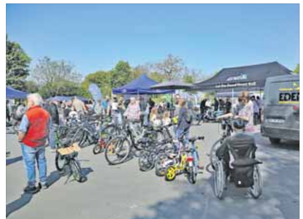
Die Premiere des Mobilitätstags Ilvesheim stieß auf großes Interesse.

250 Besucher beim 1. Mobilitätstag auf dem Festplatz