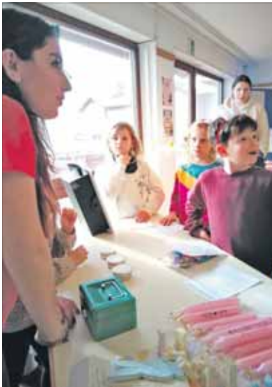
Mit Kreativität und guter Zusammenarbeit wurde die Ostereiersuche 2026 zu einem vollen Erfolg.