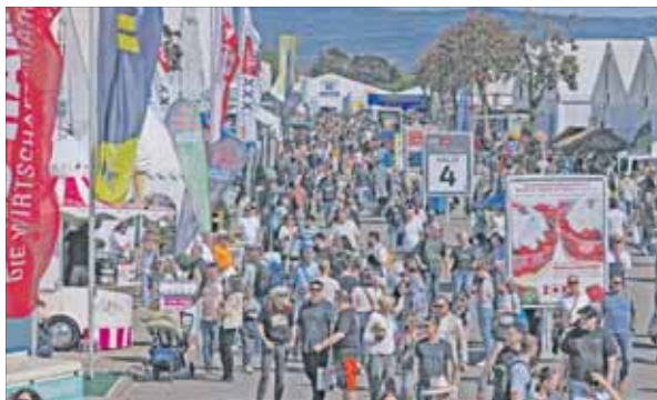
An den elf Tagen haben insgesamt 256.000 Menschen (Vorjahr: 250.000) den Maimarkt besucht.

Messegeschäft meist besser als allgemeine Konjunkturlage