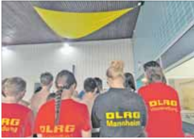
Ein Abschied, der schwer fiel: Die DLRG Mannheim nutzte das Seckenheimer Hallenbad seit über 30 Jahren als Ausbildungsstätte.

SECKENHEIM. Am Samstag, 18. April 2026, fanden im Seckenheimer Schwimmbad die letzten Schwimmkurse der DLRG Mannheim statt. Mit der Schließung des Bades fällt für den ehrenamtlichen Wasserrettungsverein eine jahrzehntelange Ausbildungsstätte weg. Die DLRG Mannheim war seit Beginn des Badebetriebs in den frühen 1990er Jahren im Seckenheimer Hallenbad aktiv und hat dort kontinuierlich Schwimmkurse durchgeführt und begleitet. Zahlreiche Kinder, Jugendliche und Erwachsene haben dort das Schwimmen erlernt oder ihre Fähigkeiten weiterentwickelt. Manche von ihnen sind mittlerweile selbst DLRG-Rettungsschwimmer. „Mit jeder wegfallenden Wasserfläche reduzieren sich unsere Ausbildungsmöglichkeiten deutlich“, erklärt die DLRG Mannheim im Zusammenhang mit der Schließung des Seckenheimer Hallenbades. Diese erfolgt durch die Stadt Mannheim vor dem Hintergrund steigender Kosten. Eine Entwicklung, die die DLRG Mannheim mit Sorge sieht, da bereits absehbar sei, dass auch weitere Schwimmbäder betroffen