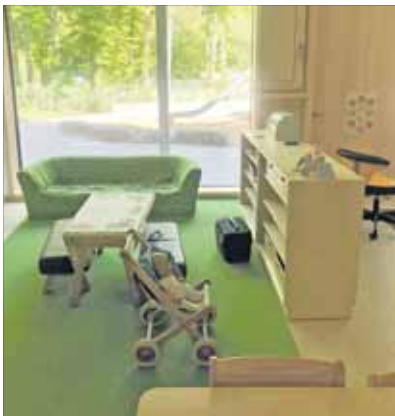
Ein großzügiges Außengelände sowie Innenräume mit Blick ins Grüne kennzeichnen die neue Familien-Kita.

HOCHSTÄTT. Es war ein langer, fast zehn Jahre dauernder Weg, bis zur neuen Städtischen Familien-Kita auf der Hochstätt. Als 2016 klar war, dass die katholische Kirche Mannheim das Gemeindezentrum Heilig-Kreuz verkaufen wollte, interessierte sich zwar die damalige Lebenshilfe Mannheim für das Grundstück, gab diese Pläne 2017 jedoch aus Kostengründen auf. Im September 2020 ging das Grundstück in städtische Trägerschaft über.