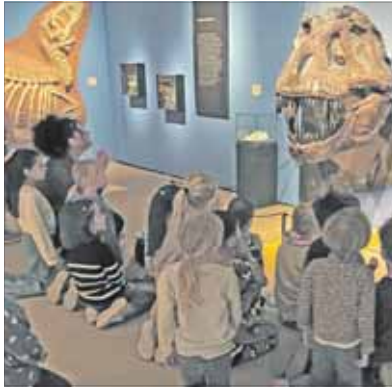
Auge in Auge mit den Sauriern.

Heinrich-Vetter-Stiftung vergab erneut Kindergarten-Award