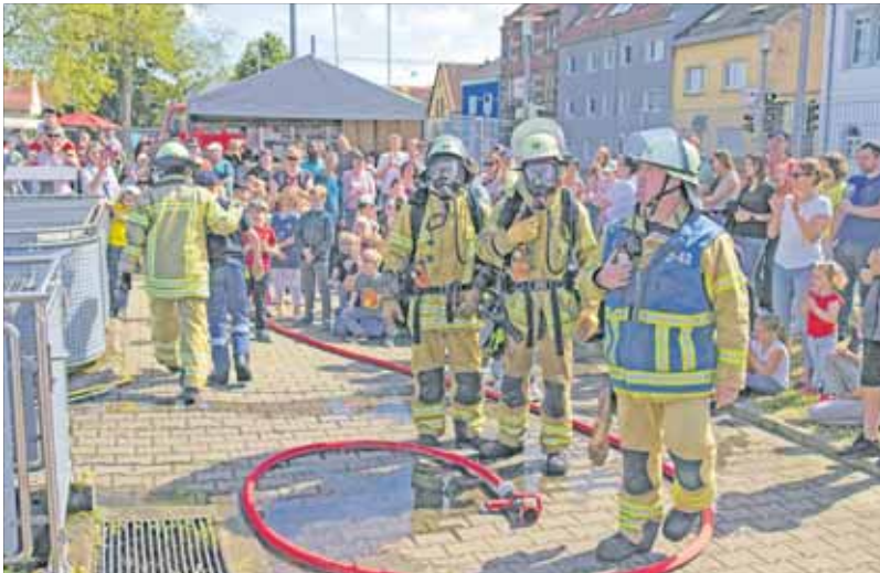
Die Schauübungen sind jedes Jahr aufs Neue eine der Attraktionen beim Tag der offenen Tür.