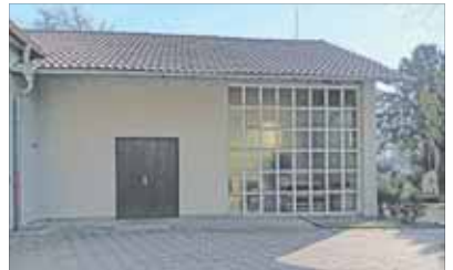
Die Tage der alten Trauerhalle sind gezählt.

SECKENHEIM. Wenn alles nach Plan läuft, wird die alte Trauerhalle auf dem Friedhof im Mai abgerissen, und der Rohbau des neuen Gebäudes könnte Ende 2026 stehen. „Gute Nachrichten“, wie der Vorsitzende des Fördervereins Friedhof Seckenheim, Manfred Falkenberg, sagt. Denn mit der Erweiterung der Trauerhalle gebe es künftig mehr Sitzplätze. Der Förderverein selbst möchte sich für die Innenausstattung engagieren und plant dazu Spendenaktionen. Gedacht ist an eine Stuhlpatenschaft ebenso wie an Patenschaften, die für Segmente des „Rosenfensters“ übernommen werden könnten. „Die Spender würden selbstverständlich genannt, insofern sie das wünschen“, so Falkenberg. Geschehen könne dies beispielsweise gebündelt auf einer Tafel im Außenbereich. Darüber soll sich Vorstand des Vereins mit dem Eigenbetrieb Friedhöfe ebenso abstimmen wie über weitere Dinge den Abriss und den Bauverlauf betreffend. pbw