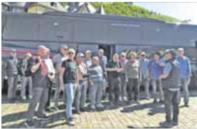
Nicht nur in der Basilika in Trier, sondern auch nach der Fahrt mit dem Moselschiff und vor der endgültigen Heimfahrt, wurde gesungen.