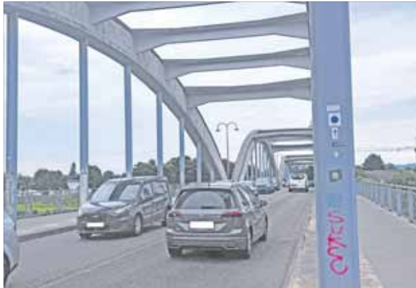
Die Neckarbrücke zwischen Seckenheim und Ivesheim wird 2027 einhundert Jahre alt.