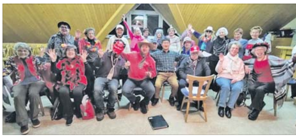
So lange geprobt, bis sie drowwe waren.