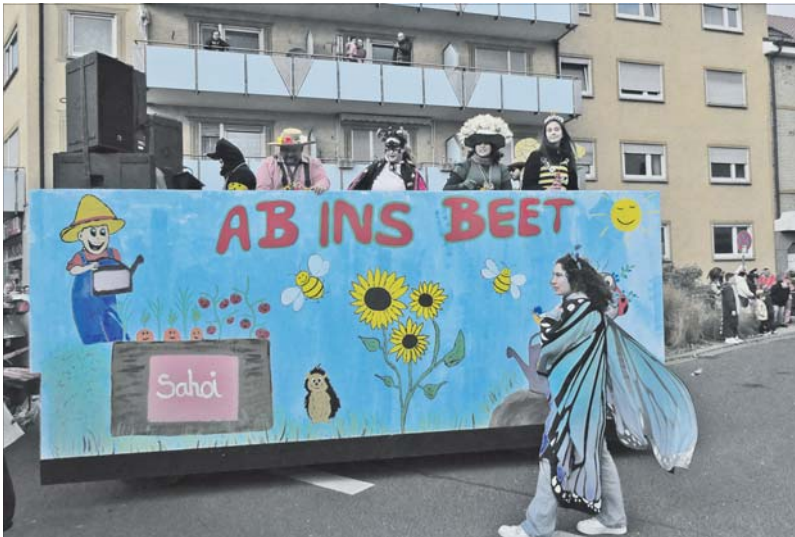
Die Gemeindejugend von St. Bartholomäus fordert auf: Ab ins Beet!