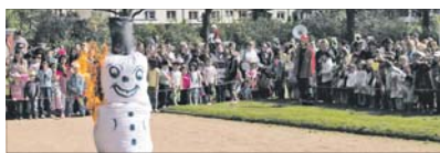
Der Winter brennt.

nen durch, wann einer stattfindet. In Sandhofen ist es der Sonntag, 22. März. Freihalten!