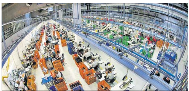
HAIX® verfügt über die modernste Produktion in Europa.