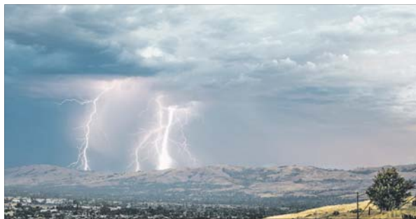
Weltweit gibt es etwa 4 Millionen Blitze pro Tag.