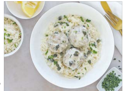
Beliebtes Familienrezept neu entdeckt: Puten-Königsberger-Klopse mit Reis.