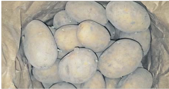
Den Charme der Kartoffel: gemeinschaftlich entdecken.

Die Kartoffelaktion 2026 startet mit neuen Impulsen