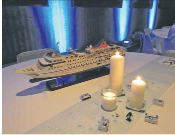
Mit allen Sinnen auf die Reise des Lebens eingestimmt: Deko beim Weißen Abend von Mal Anders Reisen.

Am Südpol ist alles anders; nichts verhält sich so, wie wir es aus dem Alltag oder aus anderen Reisen kennen. Mal Anders Reisen machte sich