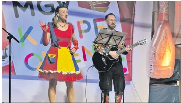
Ausgelassene Atmosphäre, Heiterkeit und viel Applaus gab's beim MGV.

Ausgelassene Atmosphäre beim MGV-Kappenabend