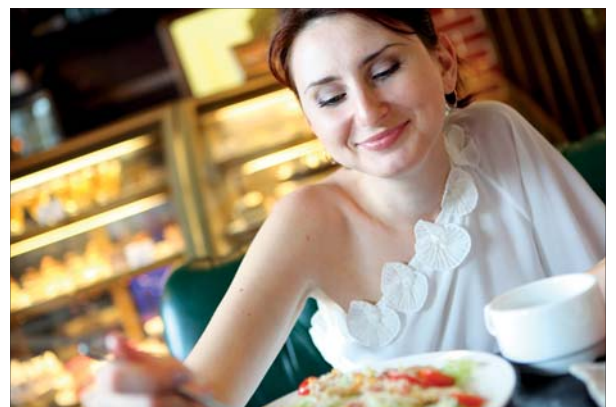
Fair verkosten kann man 26. September im Technischen Rathaus auf dem Lindenhof.