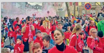
TSV-Zugnummer mit 160 Mitgliedern beim Neckarauer Umzug.