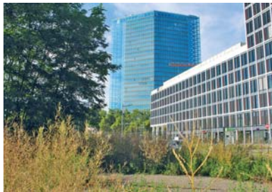
Das Grundstück am Lindenhofplatz ist wieder im Eigentum der Stadt Mannheim.

Freies Grundstück am Lindenhofplatz wieder im Eigentum der Stadt Mannheim