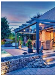
Ein individuell geplanter Wintergarten kann das Eigenheim aufwerten.

LAMPERTHEIM. Das Eigenheim aufwerten und näher an die Natur heranrücken: Das sind Vorteile, die sowohl Wintergärten als auch Terrassendächer bieten. Gleichzeitig weisen die Glasbauten deutliche Unterschiede auf. Welche Variante die eigenen Wünsche erfüllt, hängt vor allem von einer Frage ab: Möchten die Hauseigentümer mit einem beheizbaren Wintergarten zusätzlichen, ganzjährig nutzbaren Wohnraum schaffen – oder genügt ihnen ein geschützter Freisitz auf der Terrasse, um die Gartensaison zu verlängern? Die Firma Karl Arlt bietet vielfältige Lösungen eines deutschen Herstellers. Der 1987 gegründete und in zweiter Generation geführte