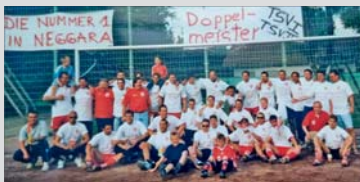
2002: TSV 1 und 2 können die Meisterschaft feiern.