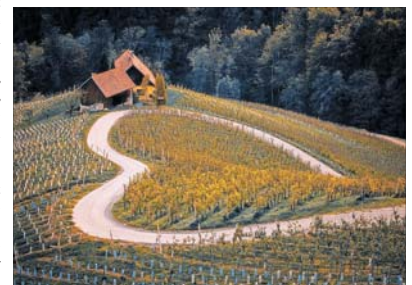
Der Herbst lockt mit seinen schönen Farben hinaus in die Natur.

Auch wenn lange Herbstabende prädestiniert sind, es sich mit einem Buch zuhause gemütlich zu machen, mal wieder das Handarbeitszeug hervorzuholen oder einen Abend mit Freunden auszumachen, so ist der Herbst alles andere als eine reine Indoor-Saison. Die letzten warmen Sonnenstrahlen laden ein zu Spaziergängen, Radtouren, Wanderungen, Ausflügen, Kurzreisen. Wellness-Wohlfühlmomente tun Körper und Seele gleichermaßen gut.