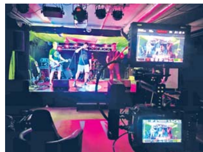
„Die Arschgeigen“ bei der Produktion ihres Videos.

Am 14. September folgt nun die nächste Veranstaltung: Bei „Ladies on Stage“ rocken in der Niederfeldstraße 122 (Einlass: 19 Uhr) drei Frauenbands bei freiem Eintritt die Bühne. Für diesen Abend mussten die Organisatoren ausnahmsweise den Radius für die Aufnahme ins Line-up etwas vergrößern. Grund: Es gibt offen-