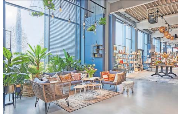
Ein ansprechendes Ambiente lädt zum Schauen und Stöbern ein.

BRÜHL. Die Blätter fallen, die Temperaturen sinken – doch in der Trendfabrik wird es heiß! Vom 4. bis zum 6. Oktober feiert der Tempel der Markenmode das große Season Opening Wochenende in der Albert-Bassermann-Straße 29 und präsentiert die neuesten Styles und Trends, die Kunden perfekt durch die kältere Jahreszeit bringen. Mit angesagten Modehighlights wird dem Herbst so richtig eingeeht! Ein besonderes Highlight ist der verkaufsoffene Sonntag am 6. Oktober. Besucher können die Gelegenheit nutzen und entspannt durch die vielfältige Auswahl an neuen Kollektionen stöbern. Dabei gibt es nicht nur neue Marken und coole Styles zu entdecken, sondern auch exklusive Angebote, die nur an diesem Wochenende gelten.