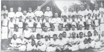
Die Turnergeneration im Jahr 1920.