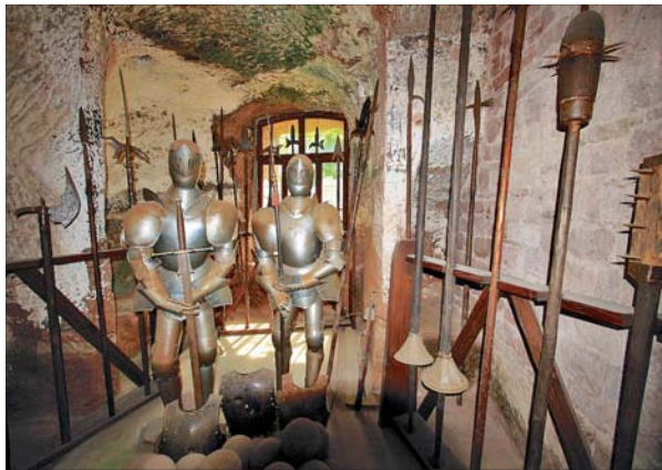
Rüstungen und Waffen sind in der Burg Berwartstein zu sehen.