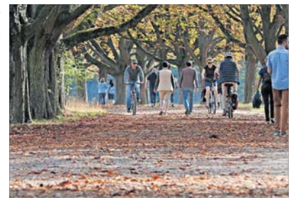
Mit dem Rad oder zu Fuß kann man sich auch im Herbst Bewegung draußen verschaffen.

Doch auch Orange, Blau, Olive, Grün und ein dunkles Lila lassen sich gut mit Grau-, Beige-, Natur- und Taupeönen kombinieren. Die Hosen werden wieder etwas weiter, auch die Kleider fallen locker. Strick liegt ebenso im Trend wie Blazer, Hosenzüge und farbige Wollmäntel.