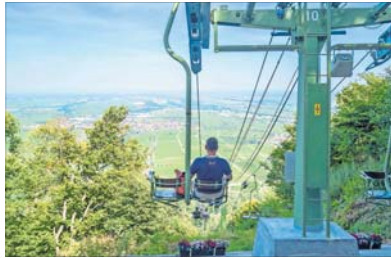
Die 1. Pfälzische Sesselbahn ist ein beliebtes Ausflugsziel.

EDENKOBEN. Die Rietburgbahn in Edenkoben ist ein beliebtes Ausflugsziel, besonders im Herbst zur Kastanienzeit. Bequem geht es an der frischen Luft in nostalgischen Doppelpesseln vom Schloss Villa Ludwigshöhe hinauf zur Ruine Rietburg. Neben der herrlichen Aussicht von einer der schönsten Aussichtsterrassen der Südpfalz und der Möglichkeit zur Einkehr in die Gaststätte, bieten sich den Besuchern viele Wandermöglichkeiten – vom kleinen Rundweg bis hin zu größeren Touren zu den Hütten und Gaststätten im Pfälzer Wald. Kinderwagen leuchten beim Besuch des kleinen Damwildgeheges gleich hinter der Bergstation. Die Rietburgbahn ist über die A65, Ausfahrt Edenkoben zu erreichen. Am Ausflugsziel an-