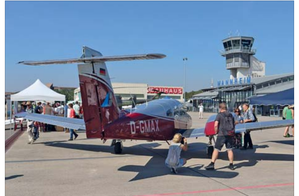
Flugzeuge hautnah erleben kann man beim Tag der offenen Tür am 14. September.