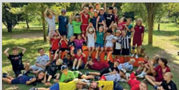
Seit 1899 ist die Jugend die Zukunft des Vereins.