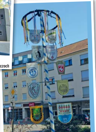
Kerwebaum: Weithin sichtbares Zeichen für „hier wird gefeiert“: der Kerwebaum.