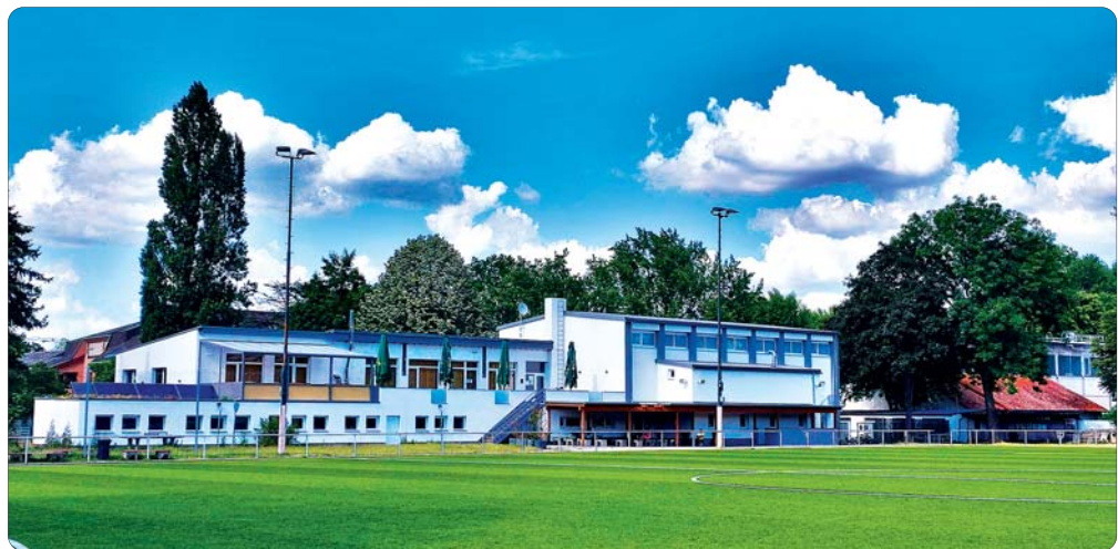
Seit 1962 die Heimat des TSV Neckarau: Das Clubhaus und die Sportplätze am Kiesteichweg.