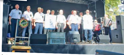
Seebaaren: Schon traditionell singen die Rheinauer Seebaaren zum Festauftakt.