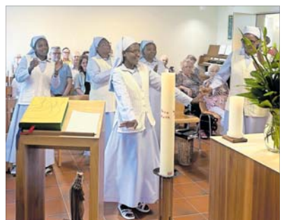
Im Gottesdienst sangen die Schwestern ein Lied und tanzten dazu.