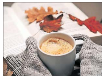
Wird's draußen ungemütlich, kann man es sich drinnen gemütlich machen.