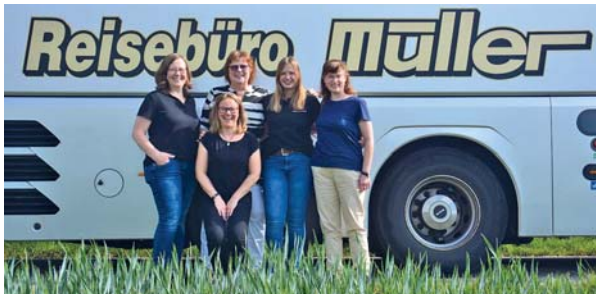
Qualifiziert ist auch das Team vom Reisebüro Müller.

MANNHEIM/BIBLIS. Zum nunmehr fünften Mal hat das Reisebüro Müller den Tourist Award beim Thema Omnibusreisen in der Kategorie Mittelstand gewonnen. Bewertet wurden Hotelqualität, das Preis-Leistungs-Verhältnis und der Komfort der Reisen. Mit der Gesamtnote „sehr gut“ wurde das Reisebüro Müller mit dem Tourist Award ausgezeichnet. Seit mehr als 70 Jahren ist das Unternehmen Reise-Partner für qualitativ hochwertige Bus-, Rund- und Fernreisen. Die Gäste genießen entspanntes Reisen von Anfang an. Es beginnt mit der kostenlosen Taxiabholung mit dem TÜV-Gütesiegel „Busreisen“. Gäste finden überwie-