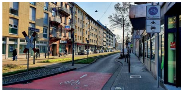
Um einen lebenswerten Lindenhof auch im Alter geht es beim ersten Netzwerktreffen am 1. Oktober.

BIG: Erstes Netzwerktreffen am 1. Oktober