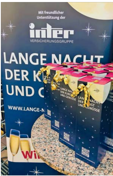
Seit 20 Jahren präsentieren sich Geschäfte in Mannheimer Stadtteilen bei der Langen Nacht.

In diesem Jahr kann die „Lange Nacht der Kunst und Genüsse“ auf eine 20-jährige Erfolgsgeschichte zurückblicken. Zum runden Geburtstag wird es ein attraktives Gewinnspiel geben. Aber es warten auch einige Besonderheiten auf die Besucher. So werden neben dem beliebten Busshuttle, das teilnehmende Stadtteile miteinander verbindet, auch mehrere Oldtimer-Straßenbahnen mit eigenem Musikprogramm quer durch Mannheim fahren. Außerdem wird es blinkende Anstecker und weitere Überraschungen vor Ort geben – damit die Veranstaltung zu ihrem Jubiläum ein besonders leuchtendes Beispiel liefert. Neben den regelmäßig vertretenen Stadtbezirken Sandhofen, Gartenstadt / Waldhof, Neckarstadt-Ost, Feudenheim, Wallstadt, Schwetzingenstadt / Oststadt, Lindenhof, Neckarau, Rheinau und Seckenheim werden auch Käfertal, Vo-