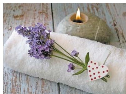
Wellness tut im Herbst besonders gut und wärmt Körper, Geist und Seele.