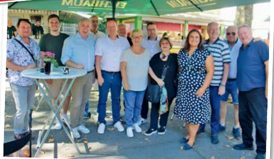
Promis: Zahlreiche Prominenz bei der Eröffnung der Neckarauer Kerwe.