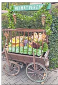
Am 21. September lädt der Heimatverein zum Erntedankfest ein.

Historisches und Kulinarisches am 21. und 26. September