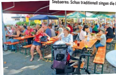
Publikum: Viele Gäste hatten sich schon zur Eröffnung auf dem Marktplatz eingefunden.