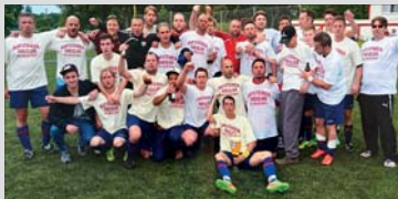
2014: Meister und Aufsteiger.