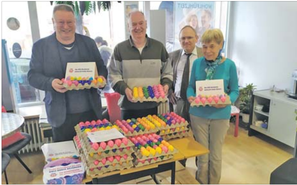
Auch in diesem Jahr verschenkt die GDS bunte Ostereier.

NECKARAU. Bunt gefärbte Ostereier haben eine 1.000-jährige Tradition. Was wäre ein Osterfrühstück ohne bunte Ostereier? Vermutlich tröstlos, weil farblos und zudem auch nur halb so wohlschmeckend. Bunte Ostereier gehören einfach zum Osterfest. Genauso ist es mit der Tradition, zu Ostern bunte Eier an Freunde und Verwandte zu verschenken. Der alt hergebrachte Brauch mit starkem Symbolgehalt wandelte sich im Laufe der Zeit. Bunte, verzierte Eier werden zu Ostern nun als Freundschaftsgeschenk und als kleine Aufmerksamkeit überreicht und sollen einfach Freude bereiten.