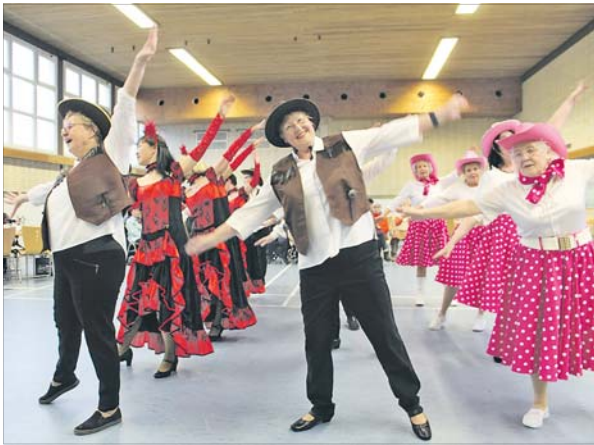
In den verschiedensten Kostümen begeisterte das AWO-Ballett.