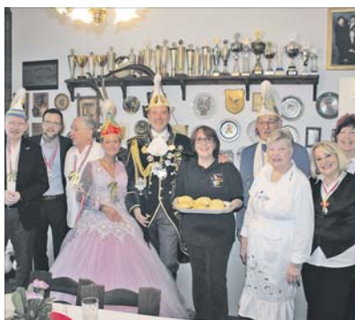
Immer wieder einer der schönsten Faschnachtsmorgens mit viel Prominenz: das Dampfnudelessen in der Pilwe-Scheuer.