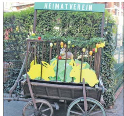
Bunte Gestecke beherrschen das österliche Ambiente beim Heimatverein.