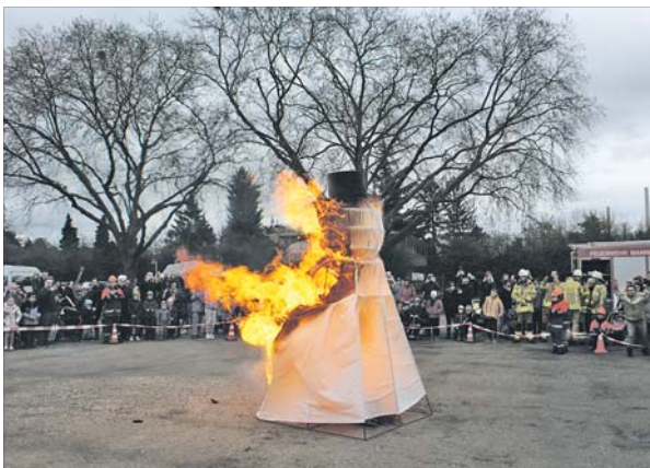
Der traditionelle Sommertagsumzug in Neckarau findet am 28. März statt.

NECKARAU. Noch wagen nur wenige, daran zu denken, aber: Der nächste Sommer kommt bestimmt. Und der wird in Neckarau traditionell vom Sommertagsumzug der Interessengemeinschaft Neckarauer Vereine (IG) eingeläutet. Dieser soll am Samstag, 28. März, steigen und auch in diesem Jahr sind Kitas, Grundschulen und Kindergruppen der Vereine wieder zur Teilnahme als Gruppe aufgerufen und zur Teilnahme eingeladen. Und natürlich kann auch jeder, der den Winter vertreiben und den Sommer begrüßen möchte, am bunten Spektakel teilnehmen. Der Umzug startet um 15 Uhr (Aufstellung: ab 14.30 Uhr) auf dem Neckarauer Marktplatz. Dort werden auch die Stecken und Brezeln verkauft (vereinzelte auch bei Bäckereien).