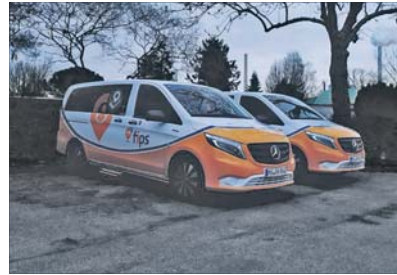
Auch am Friedhof Neckarau waren fips-Fahrzeuge stationiert.

Neckarau: fips-Angebot zum 15. Februar 2026 eingestellt