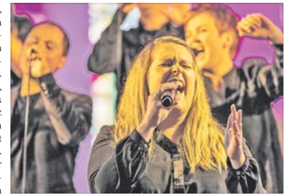
nco „Gospels zum Mitsingen“ trifft sich im März.

LINDENHOF. Am Mittwoch, 11. März, trifft sich um 20 Uhr im Gemeindezentrum Johannes „Gospels zum Mitsingen“, ein Chorprojekt mit Kantorin C. Seitz. Weitere Probenstermine: 16., 23. und 27. März, jeweils 20 Uhr, und am 28. März um 10 Uhr. Auftritte sollen dann im Abendgottesdienst in der Johanniskirche am 28. März um 18 Uhr und in der Passionsandacht in der Markuskirche am 1. April um 19 Uhr erfolgen.