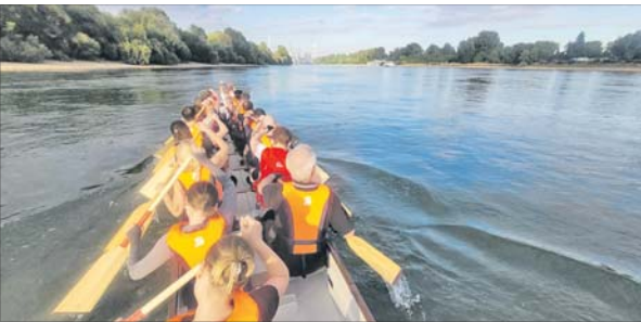
Mit einem neuen Drachenboot können die Rhein-Neckar Dragons bald bei Neckarau unterwegs sein.