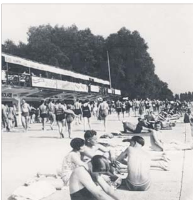
Das Strandbad-Leben ist auch den NAN immer eine Schlagzeile wert.