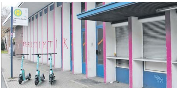
Die brachliegenden Flächen am Bahnhof liegen wohl vorerst weiter brach.

Vorschlag für Quartiersgarage am Bahnhof Neckarau gut, aber teuer