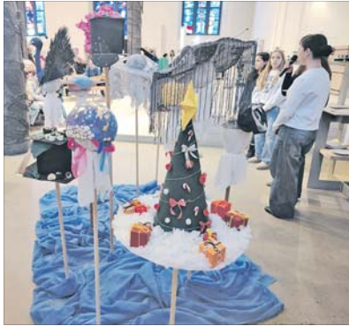
Auch Skulpturen gehören zur Augenschmaus-Ausstellung.