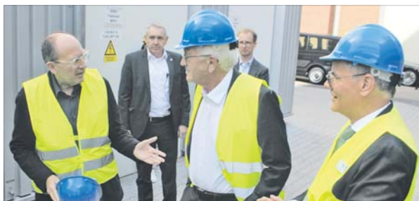
Der noch amtierende Ministerpräsident besuchte die MVV-Investition am Neckarauer GKM.

MANNHEIM/NECKARAU. Die MVV Energie AG ist nach eigenen Angaben „erwartungsgemäß“ in das Geschäftsjahr 2026 gestartet. Im ersten Quartal (1. Oktober bis 31. Dezember 2025) beliefen sich die bereinigten Umsatzerlöse des Mannheimer Energieunternehmens auf 1,7 Milliarden Euro (Vorjahr: 1,9 Milliarden Euro). Hauptgründe für den Rückgang seien niedrigere Großhandelspreise und geringere Gasabsatzmengen gewesen, so das Unternehmen in einer Mitteilung. „Das operative Ergebnis (Adjusted EBIT) lag bei 80 Millionen Euro und damit wie absehbar unter dem Vorjahreswert von 122 Millionen Euro. Die kühlere Witterung hatte einen positiven Einfluss auf das Ergebnis. Eine geringere Anlagenverfügbarkeit im Umweltgeschäft sowie Ergebnisrückgänge im Erzeugungsbereich und im Geschäftsfeld Commodity Services wirkten sich hingegen negativ aus.“ „Unser Start ins Geschäftsjahr 2026 liegt angesichts des an-