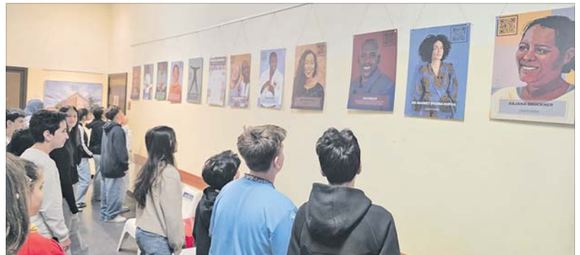
Interessierte Schüler bei der Ausstellung „Black Heroes“ an der Wilhelm-Wundt-Realschule.

Ausstellung „Black Heroes“ an der Wilhelm-Wundt-Realschule