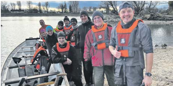
Die Drachenbootler freuen sich auf neue Mitpaddler.

NECKARAU. Der Drachenbootsport bietet nicht nur ein effektives Ganzkörpertraining, sondern fördert auch Gemeinschaftssinn und den Spaß an der Bewegung in der Natur. Dabei verbindet dieser Teamsport Kraft, Ausdauer und Technik – Eigenschaften, die insbesondere für das Wettkampfttraining wichtig sind. Das bunt gemischte Team der Rhein-Neckar Dragons des Kanu-Sport-Club e. V. Mannheim-Neckarau freut sich über neue Mitpaddlerinnen und Mitpaddler, die Lust haben, sich sportlich zu betätigen und die Herausforderung des Drachenbootsports kennenzulernen. Egal, ob Einsteiger oder erfahrene Paddler – alle sind herzlich