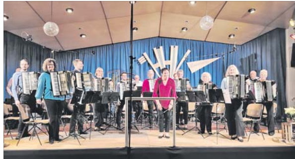
Der Rheinauer HHV ist zu Gast bei den Nachtklängen.

Konzert am 20. März in der St. Jakobus-Kirche